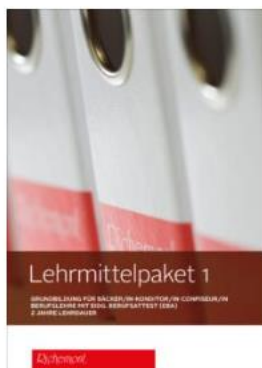
Lehrmittelpaket 1 (EBA)

Auf „ LEHRMITTELPAKET “ klicken und passendes Lehrmittelpaket suchen.